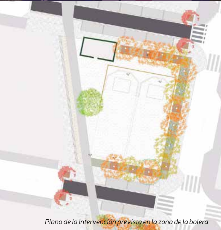
Plano de la intervención prevista en la zona de la bolera

Además, cabe destacar que en el marco del Plan EDUSI León Norte también se está llevando a cabo la creación de un nuevo espacio verde y de juegos infantiles en la calle Rañadoiro. En este punto se han retomado las obras que encaran la recta final con la instalación del vallado y de una estación de riego. ■